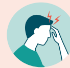
MAUMIVU YA KICHWA

Jee, umesafiri nje ya nchi katika siku 14 zilizopita?