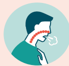
سرفن ی گنت